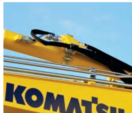
Hydraulické zámky výložníku a násady