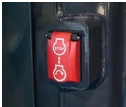
Pomocný vypínač motoru